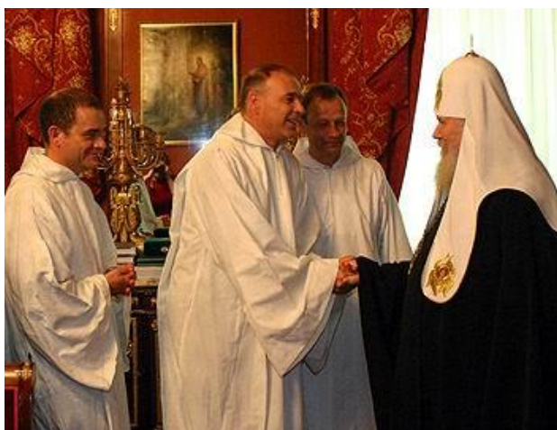
Фото 10. Алексей II, Алоис, Люк и Матфей

XX век был отмечен экуменическими надеждами, ожиданиями, но они не оправдались, и не оправдались именно потому, что люди «занимались экуменизмом». Брат Роже «экуменизмом не занимался», но при этом он один из немногих, кто сделал нечто реальное для Единой Церкви Христовой: он создал общину, в которой христиане разных культур, разных традиций смогли жить и молиться вместе. Он этим показал, что так можно жить, что Единая Церковь реальна".