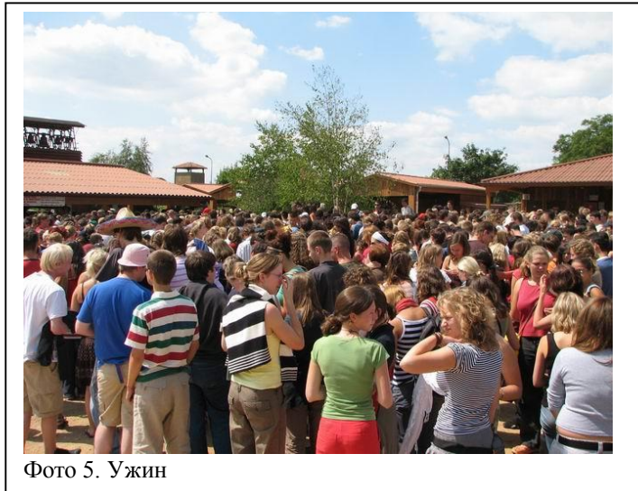
Фото 5. Ужин

Чуть позже к нам поселили двух ирландцев, немца и профессора из Гонолулу 1 .