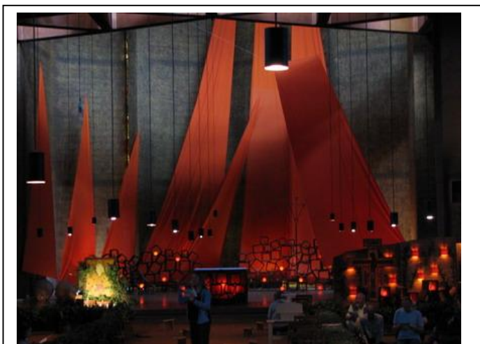
Фото 6. Оранжевый "иконостас"

Самая торжественная служба — в субботу вечером, "служба Света", когда все молящиеся держат свечи. Храм украшен призывом: "Пусть всякий входящий сюда примирится: брат с братом, сестра с сестрою, народ с народом" (Сайт: Библиотека Якова Кротова).