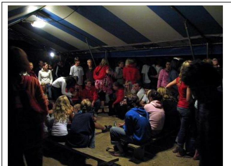
Фото 12. Айяк

Везде виден высокий уровень организации встреч и многолетний опыт братьев по работе с многотысячными группами.