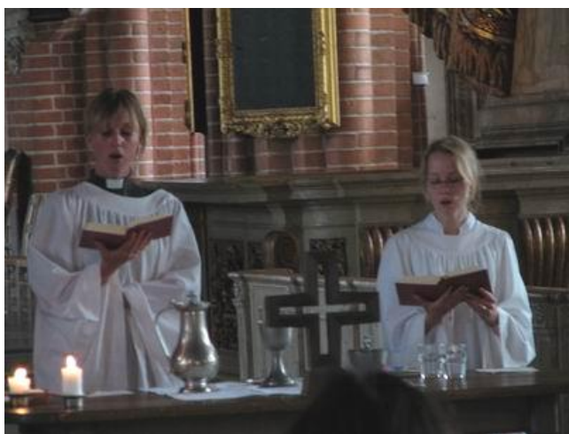
Фото 3. Храм св. Николая (Стокгольм, дневная служба)

Во время вечерней службы храм наполняется не только туристами и прихожанами, но и собравшимися со всего света паломниками, для которых интересен сам обряд поклонения Христу. Вечерняя служба в базилике мало, чем отличается от подобных католических обрядов в других церквях, по крайней мере, на первый взгляд. Чернокожий священник, читающий молитву 5 августа 2006 года, был похож на партийного деятеля, призывающего голосовать за свою партию. Толпы туристов входили в храм в одни ворота и, чуть послушав проповедь, быстро выходили в другие.