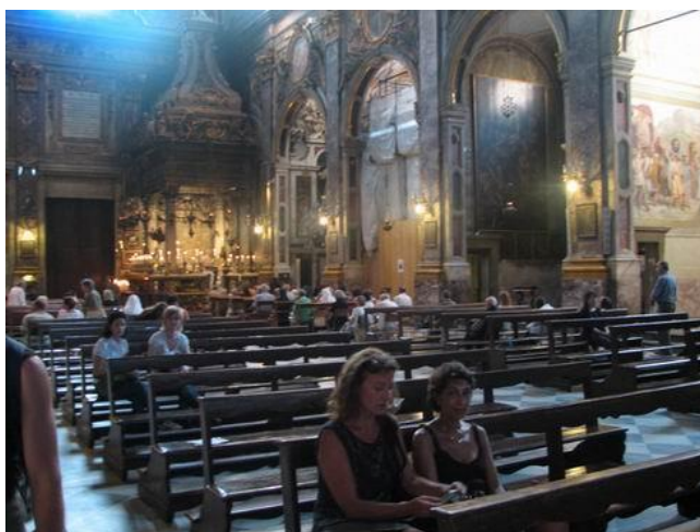
Фото 2. Вечерняя служба (Флоренция)