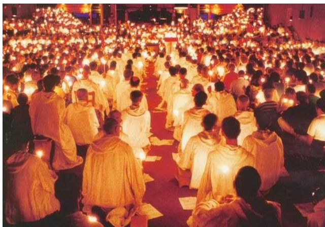
Фото 7. Молитва

Богослужение началось в 20.30, а перед этим братья в белых одеждах выходили по одному из помещения справа от алтаря. Алтарь представляет собой сцену, на которой натянуты вертикально 8 оранжевых 1 полотнищ, напоминающих паруса (см. фото 6) и рассаживаются внутри огороженного небольшим заборчиком из декоративного кустарника пространства, уходящего внутрь храма метров на 40 — 50. Справа, слева и сзади этого отгороженного пространства располагаются паломники.