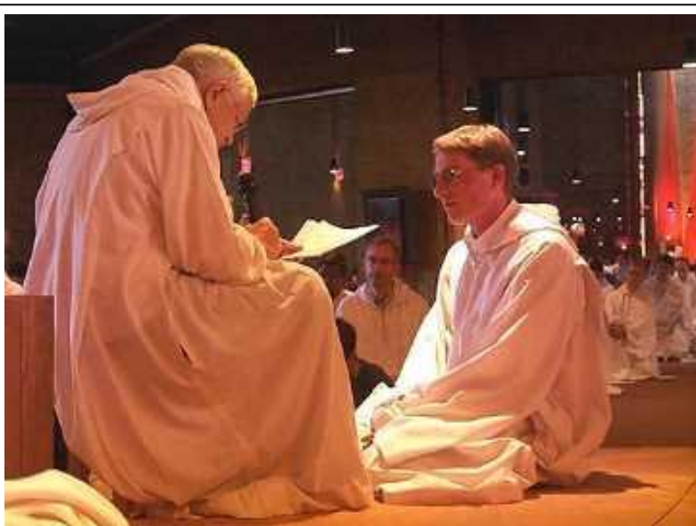
Фото 13. Посвящение в монахи

Брат прибыл в Санкт-Петербург 4.10.2006. В 16.30 посетил Вальдорфскую школу, учителя которой организовывали поездку в Тэзе. Время было не совсем удобное, поэтому пришло на встречу не более 11 человек. Все были рады встретиться вновь после поездки. Видно, что и брат был рад встречи. Это приятный человек, знающий несколько языков, умеющий вести