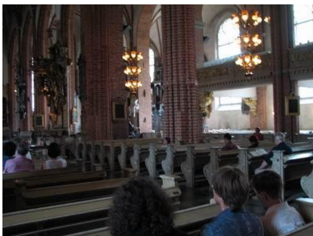
Фото 1. Храм св. Николая (Стокгольм)

матся вверх по великолепной лестнице, ведущей к фасаду церкви и лавировать между людьми, сидящими на ступеньках, поющими, играющими, пьющими различные напитки или просто глядящими на панораму вечернего Парижа.