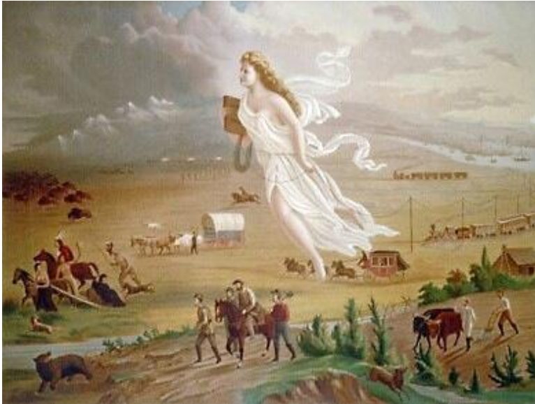
Картина Джона Гэста «Американский прогресс» (1872 г.), изображающая Колумбию (символ США, предшественница «дяди Сэма»), прогоняющую индейцев с их земель во имя продвижения цивилизации на Запад.

Некоторые аспекты геноцида коренного населения нашли своё отражение и в искусстве США. Слева представлена картина Джона Гэста «Американский прогресс». Обратим внимание на два обстоятельства: