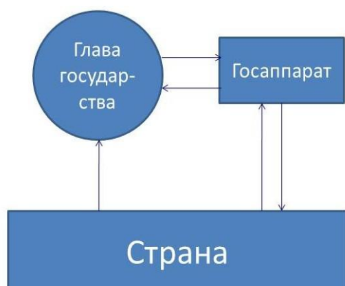
Рис. 2. Государственное управление при отсутствии профессионального блока концептуальной (жреческой) власти

В результате многовекового осуществления библейского проекта сложился современный нам Евро-Американский конгломерат государств, каждое из которых управляется по схеме, представленной на рис. 2 ниже по тексту. При этом их общества утратили концептуальную властность в какой бы то ни было форме, вследствие чего лишились способности управляться по полной функции, т.е. реального суверенитета.