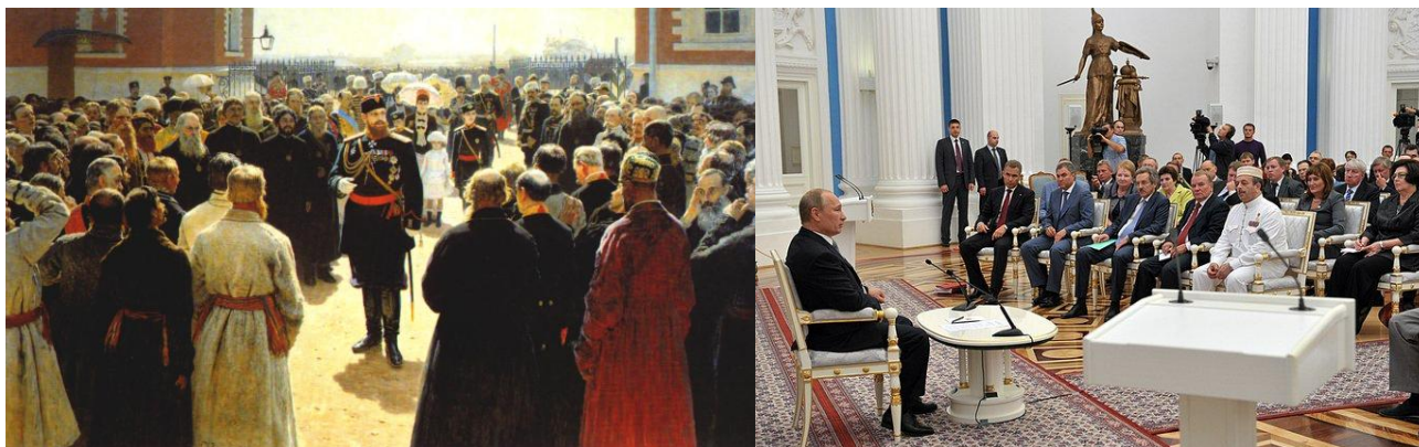
1 См. сноску внизу страницы.

Пока же государственная власть России «балаганит» на тему « кто придумает консолидирующую идею? », — приверженцы буржуазно-либеральной идеи (при реализации которой госчиновники — всего лишь наёмники глобальной корпорации ростовщиков, ответственные перед ними) «бодаются» с приверженцами идеи «элитарно»-чиновничьего государства в борьбе за власть над Россией с целью эксплуатации её природных и людских ресурсов 2 .