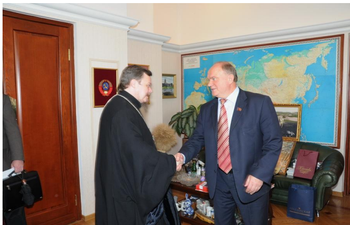
Дух Бендера витает над ними: Почём будем торговать «опиум для народа»?

На этот проект работают и многие «раскрученные» политические аналитики, возможно сами того толком не понимая: М.Л.Хазин, С.Е.Кургинян, М.В.Леонтьев, С.А.Марков, Н.В.Стариков, М.Калашников и другие. Втянулась в него и КПРФ.