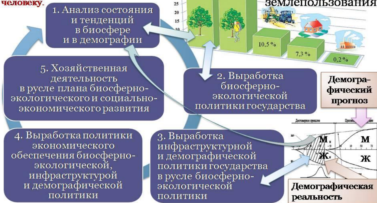
Рис. 1. Взаимная обусловленность частных управленческих задач в ходе реализации концепции устойчивого развития.

Деньги – «слуга», а не «господин» человеку.