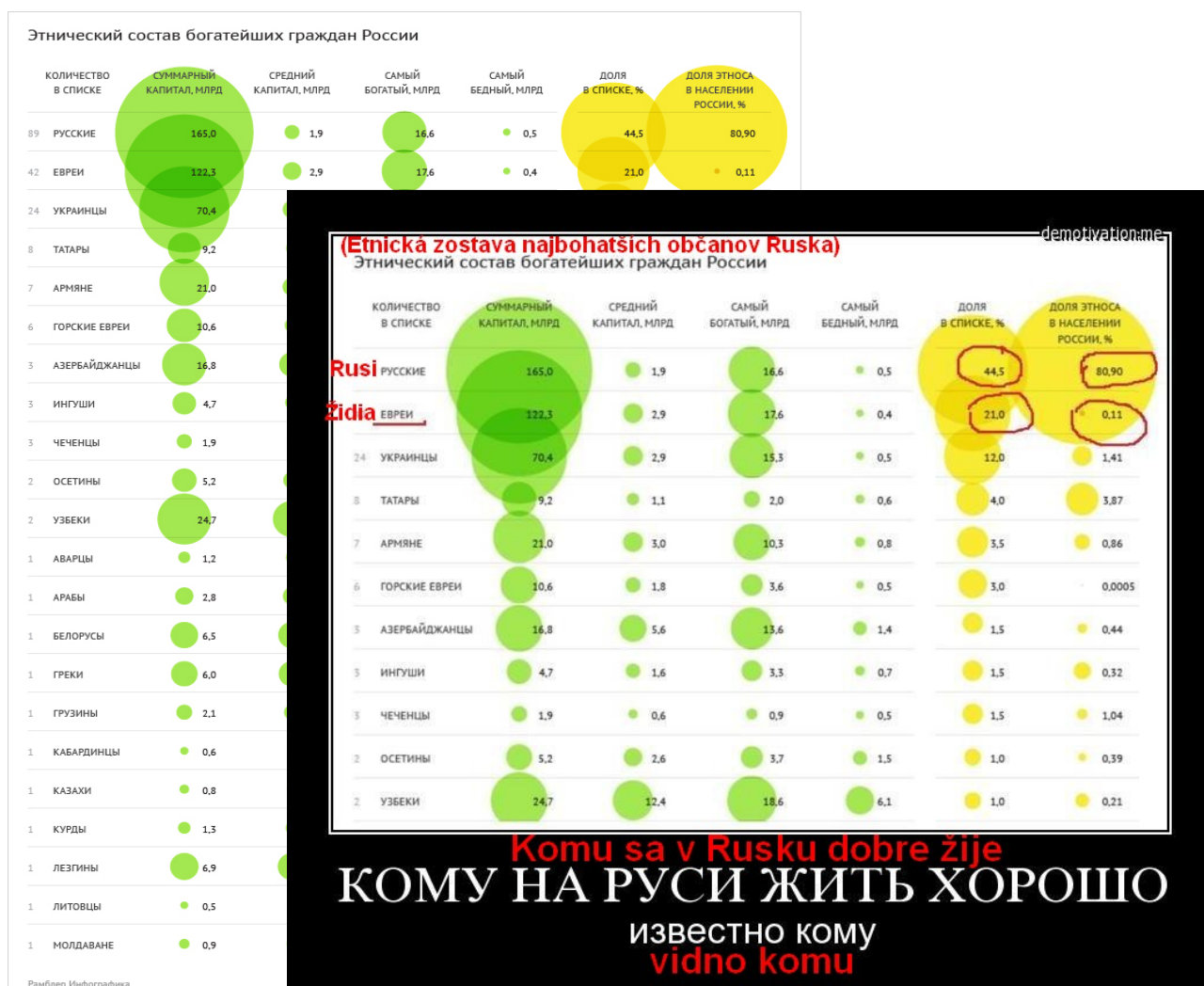
Obr.2 Zľava originálny obrázok zo stránky http://lenta.ru/articles/2014/10/27/reachethnic/ . Je to jedna z ilustrácií k článku "Кому sa v Rusku dobre žije?" (Projekt Lenty.ru pre štúdium elity - etnická zostava najbohatších občanov Ruska). Zprava v predu - z internetu vzatý fragment toho istého obrázku, a po prejení intelektuálnym spracovaním v procese socialnej psychodynamiky: odpoveď na otázku "komu sa dobre žije a úkor komu?" - bude: príslušné sociálne skupiny zakrúžkované červenou.

kultúr a subkultúr, alebo sa takýmto objektom stať nemôže z dôvodu ochrany pred takýmto zásahom určitým druhom prostriedkov, prípadne v určitých aspektoch sa môže stať objektom vykorisťovania a v druhých aspektoch sám začne vykorisťovať druhých. Následkom tohoto v multikultúrnom davoelitárnom spoločenstve vzniká vzájomná nespokojnosť, spojená nerovnosťou možností vykorisťovania druh druhu, ale tiež určitý druh nespokojnosti s tým, že kultúra spoločnosti recykluje režim vykorisťovania „človeka človekom“ do novej formy, namiesto toho, aby tento režim vykorenila ako konkrétny sociálny jav, a tým vytvorila podmienky pre slobodný osobnostný rozvoj pre všetkých. Aby sme nerozprávali naprázdno, obrátíme sa k ruskej štatistike zobrazenej na obr. 2.