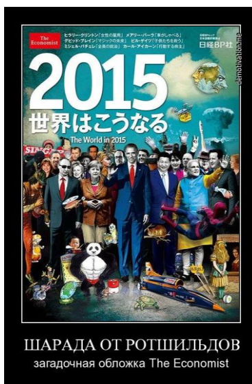
Рис. 1. «Процесс пошёл» — вопрос только: Куда?

По отношению к политике люди делятся на три категории: 1) политически безучастные, участь которых — быть жертвами политики, 2) заинтересованные наблюдатели и оценщики-комментаторы, дополняющие политически безучастных в списках жертв политики, 3) практикующие политики (и это не только государственные деятели, чьи слово и подпись придают властную силу тем или иным документам, но и те, кто добивается намеченных политических результатов иными средствами). Редакция журнала