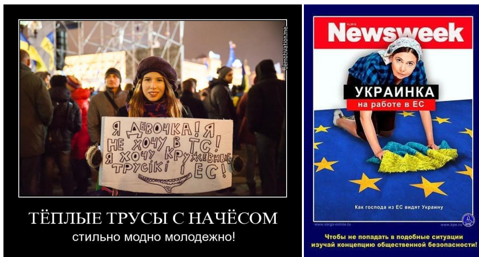
Рис. 4. Вожделения и перспективы в их наилучшем виде